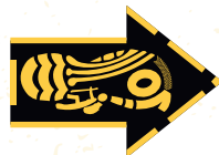
Virar a direita