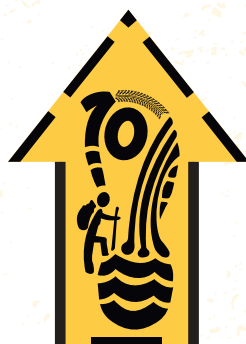
Sentido reverso de trilha