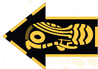
Virar a esquerda